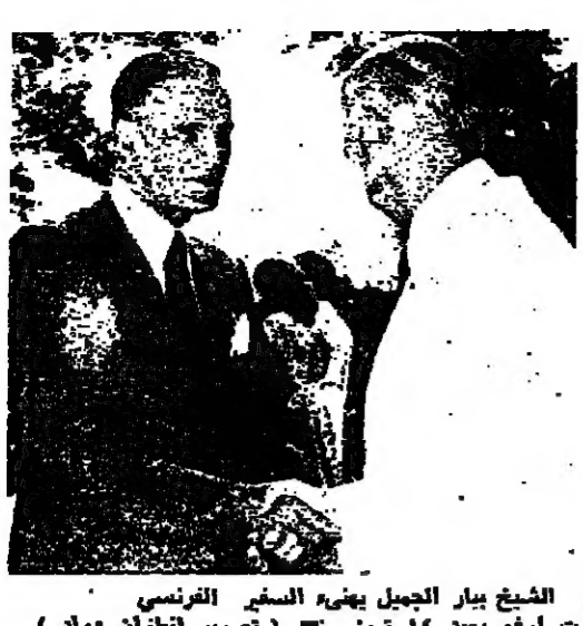
الشيخ يasar الجميل يهني السفير الفرنسي موريت ارغو بعيد 12 تموز